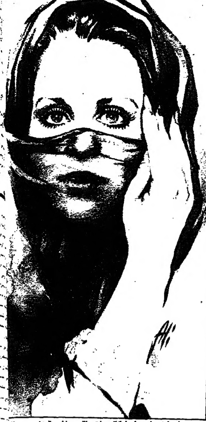
عندما تعرف عليها كانت فتاة جذابة تفصح

التي احد اعوان عنديان الخاشقجي بالمصحفة جانباً وقال يقضي لمن حوله (البعون السموم الذي عرفها فيه . لم تجلب لناسوي المشاكل والصداق . والان جاء دور الفضايح) . وتناول احد السكرتيرين المصحفة . وقرا عنوان الصفحة الاولى بالمصاحفة الصلة التي كتبتها كيم ابنة ثريا ونستون تشرشل) . وكانت المصحفة قد نشرت في ذلك المصحف عنوان اخر (ام مرفت عشيق) ، وسئل الخاشقجي وفي اسفل الموضوع المنثور كان هناك عنوان اخر (ام مرفت عشيق) ، وسئل السكرتير « هل نصل بالسريرين ونخبره ؟ » .